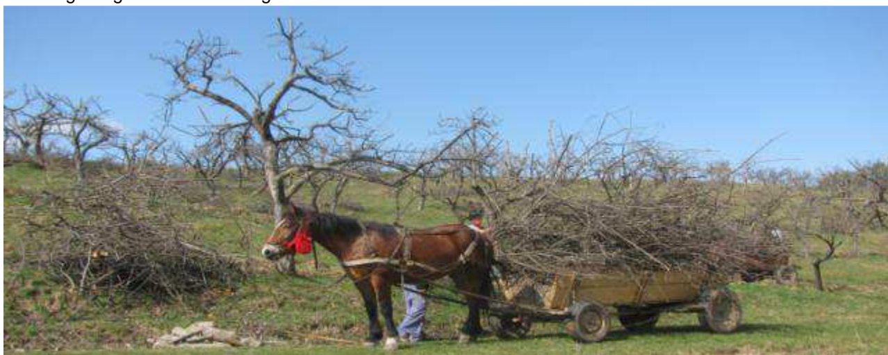
Transport von Baumschnitt mit Pferden

Wir danken für die Unterstützung dieses Erhaltungsprojektes, das buchstäblich in letzter Minute einen genetischen Schatz von europäischer Bedeutung zu bewahren geholfen hat, insbesondere danken wir der Heidehof Stiftung, Deutschland und dem Schweizerisch-Rumänischen Kooperationsprogramm