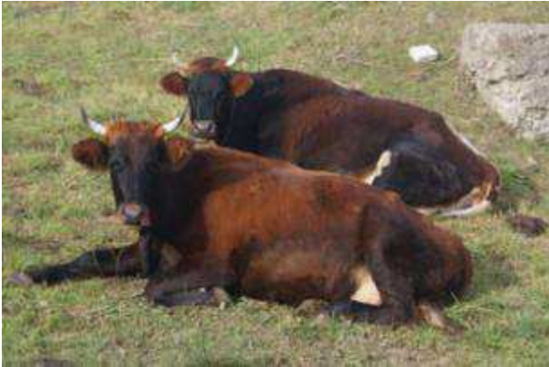
Dorna Rinder in der Ukraine

Die Lebensbedingungen in der Hutsulshina sind noch härter als in den Karpaten. Die Berge sind höher, die Winter kälter und die Vegetation weniger fruchtbar. Die einheimische Bevölkerung wird Huzul genannt. Die Menschen verdienen als Schäfer ihren Lebensunterhalt. Sie sind noch stärker als in Transkarpaten Selbstversorger und deshalb existentiell von Tieren abhängig, die perfekt der Umgebung angepasst sind. Mit den importierten Pinzgauern wurde in jüngerer Zeit eine Rasse namens Dorna herausgezüchtet. Trotzdem gibt es in Hutsulshina noch einige alte Rinder, die scheinbar noch über die ursprüngliche genetische Basis verfügen. Wie sehr sie noch der ursprünglichen Berggrasse entsprechen, ist schwer zu bestimmen. Jedenfalls wurden diese ursprünglichen Tiere, die sich von den Mocanitsa unterscheiden, sowohl in Rumänien wie auch der Ukraine gefunden. Die Rinder der Huzulen fallen durch ihre sehr kurzen Beine auf. Sie bringen es auf eine Widerristhöhe von maximal 110 Zentimetern. Im Vergleich zur Höhe ist der Körper lang, rundlich und stark, wirkt aber wenig athletisch. Der Kopf ist klein und länglich. Der Euter ist gut entwickelt. Die