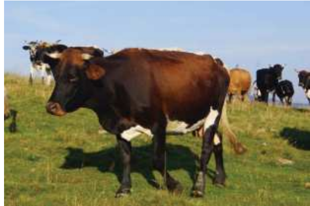
Dorna Rind in Rumänien

Tiere geben täglich bis 10 Liter Milch. Sie haben eine dunkle, braun-schwarze Farbe, die oberen Teile des hinteren Viertels haben rot-braune Schattierungen. Gespräche mit Einheimischen zeigen, dass die Rinder schon seit Generationen gezüchtet wurden. Aber auch Pinzgauer wurden schon vor langer Zeit angesiedelt und es ist meist schwierig zu erkennen, wie stark der Einfluss von