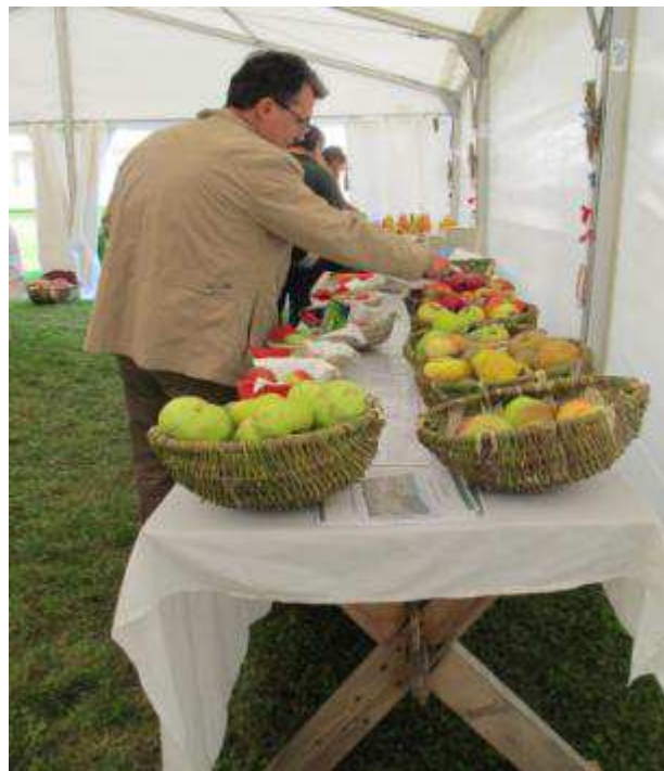
„Apple Day“ 2014 in Malmkrog (Mălâncrav)

Die Zukunft wird zeigen, wie der neu gegründete Verein die Erhaltungsarbeit fortsetzen wird. Bereits in Mitteleuropa ist es schwierig, Menschen zur Freiwilligenarbeit zu motivieren. Noch ausgeprägter ist dies in Siebenbürgen der Fall. Hier hat man in der Vergangenheit schlechte Erfahrungen mit offiziellen Körperschaften gemacht. Andererseits herrscht Armut, Arbeitslosigkeit und teilweise auch Hoffnungslosigkeit in Siebenbürgen.