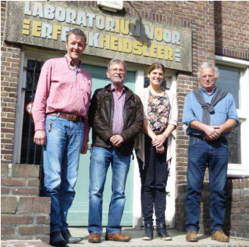
Das SAVE Network Team in Wageningen, Niederlande

Anfang des Jahres wurde das SAVE Netzwerkbüro von Konstanz, Deutschland, nach Wageningen in die Dreijenlaan 2, Niederlande, verlegt. Hier ist auch der Sitz der Universität Wageningen. Im gleichen Gebäude befindet sich die Abteilung für Genetik, wo Generationen von niederländischen Studenten der Agrarwissenschaft in die strengen Prinzipien der Genetik eingeführt wurden.