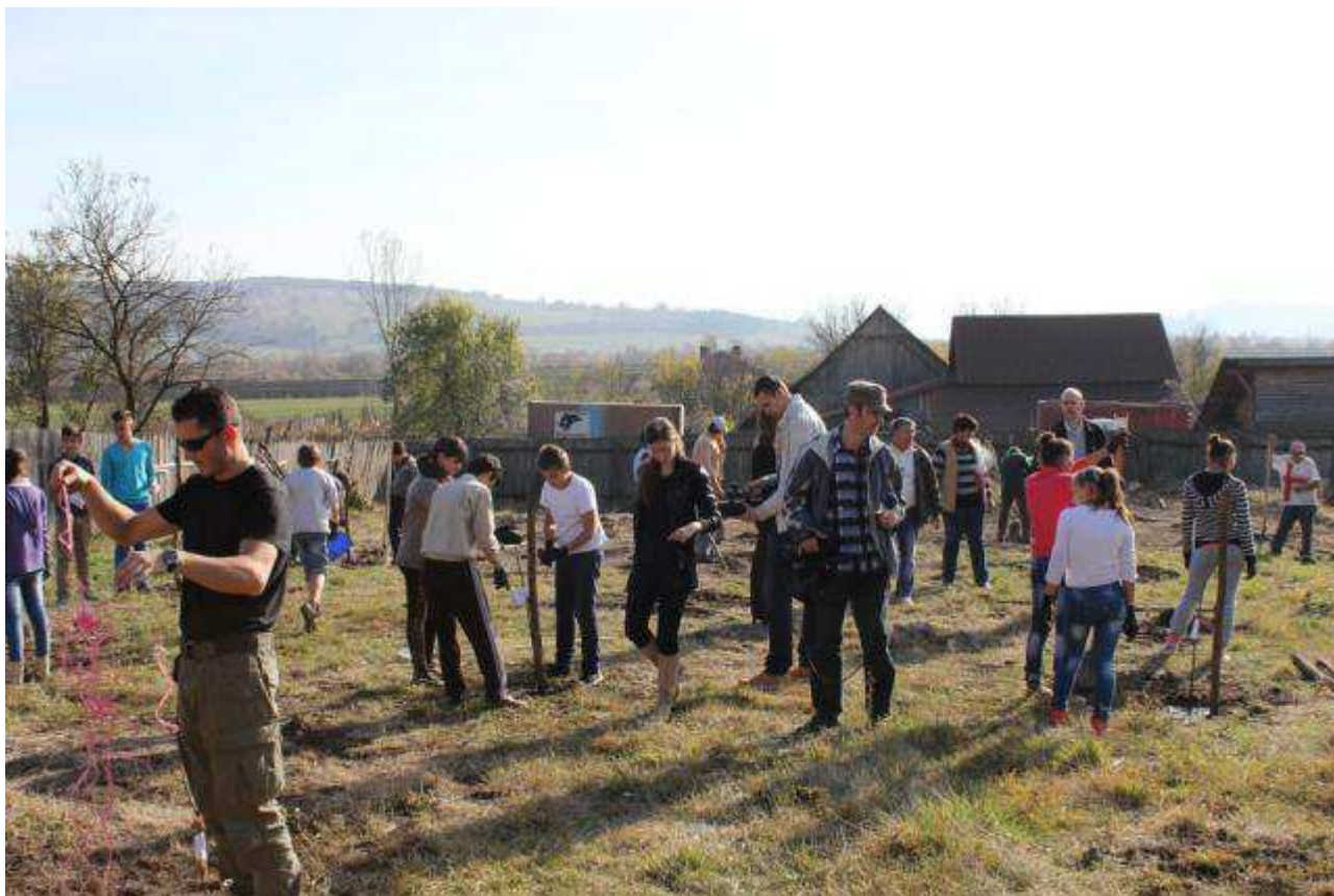
Pflanzaktion im Schulgarten von Homorod

183 Obstsorten wurden im Rahmen des Projektes "Nachhaltige Landwirtschaft in abgelegenen Gebieten von Rumänien: Erhaltung und Wertsteigerung von alten Obstsorten" in Siebenbürgen erfasst. Unterstützt wurde das Projekt durch den EU-Erweiterungsbeitrag der Schweiz (Schweizerisch-Rumänisches Kooperationsprogramm). Mit dem Projekt, initiiert durch SAVE Foundation und dem Projektpartner vor Ort, dem Mihai Eminescu Trust (MET), wird den alten Obstsorten in Siebenbürgen endlich wieder mehr öffentliche Aufmerksamkeit zuteil. Dies in nahezu letzter Minute, denn vieles von dem, was einst vorhanden war, ist bereits unwiederbringlich verschwunden. Recherchen vor Ort und in der Literatur, ein Treffen von Experten und erste Schritten zu einer Vernetzung potentieller und bestehender Akteure sowie eine Liste mit seltenen regionaltypischen Apfelsorten wurde bereits ab 2011 erstellt. Im Obstbauinstitut Bistrița wurden im April 2013 22 Obstsorten mit Pfropfreisern auf Hochstamm-Unterlagen gepfropft. Die Jungbäume wurden im Winter 2014/2015 in Malmkrog (Mălâncrav) direkt am neu entstandenen Obstlehrpfad sowie im Schulgarten des Dorfes Homorod (Hamruden, Kreis Brasov) ausgepflanzt. Vorgese-